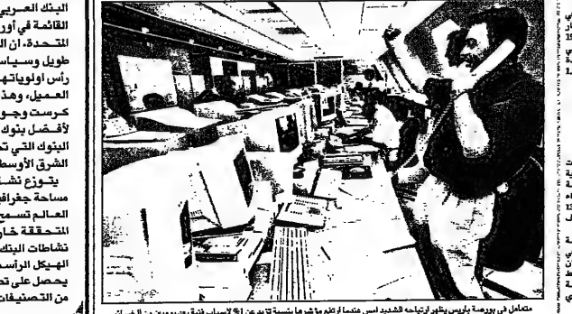
معمال في بورصة يترأسها الشهدى السيد عمارا زرع مقرها مبنية توريد من 14 اسباب الفية من يومين من المصارف